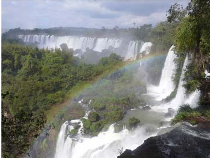
Tausend stürzt der Rio Iguazu über die Felskanten in den El Garganta Diabolo, den Schlund des Teufels

Nach einer angenehmen Nacht im Hotel von Puerto Iguazu werde ich heute die berühmten Wasserfälle an der Grenze zu Argentinien/Brasilien besuchen. Die Cataratas do Iguazu gehören zu den größten und beeindruckendsten der Welt und über einer Länge von fast 2 Kilometern(!) stürzt das Wasser bis zu 100m tief über die Felsen. Dieses Naturschauspiel ist absolut einmalig und man muss es erlebt haben um es sich vorstellen zu können.