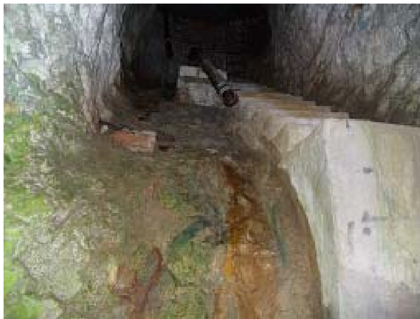
Überreste der Wasserversorgung - Regenwasser wurde aufgefangen und gespeichert