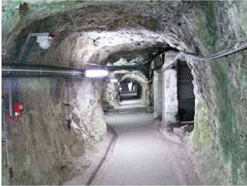
Gänge mit Unterkünften. Hier waren bis zu 15.000 (!) Mann untergebracht.