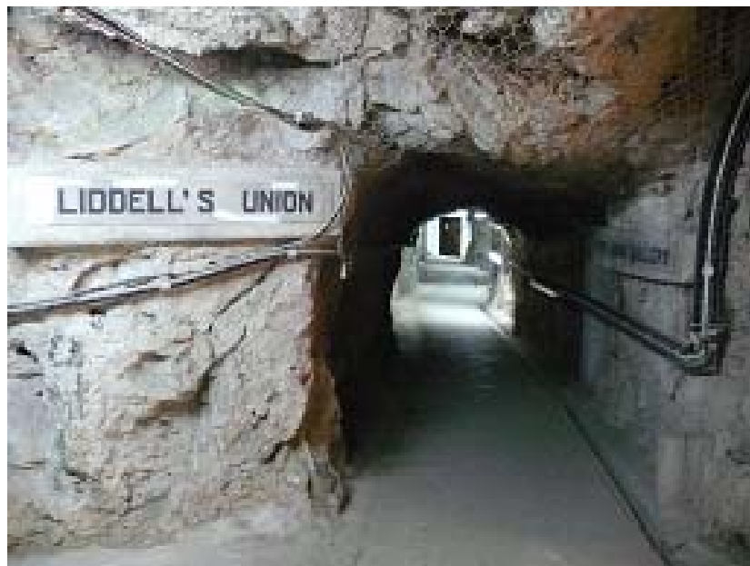
Kreuzungen mit Wegweisern