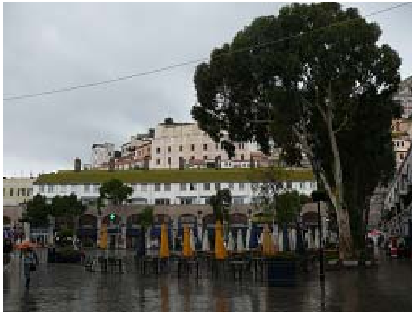
Nach der Besichtigung der Tunnel schaue ich mir auch die Stadt an.